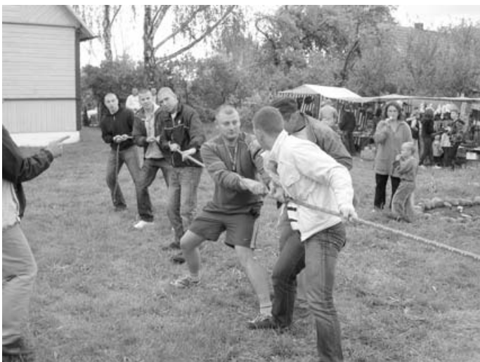
Ciągnęliśmy, ciągnęliśmy i... przegraliśmy