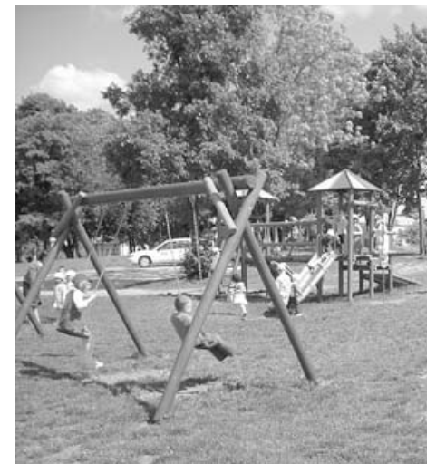
Nowe huśtawki przy przedszkolu