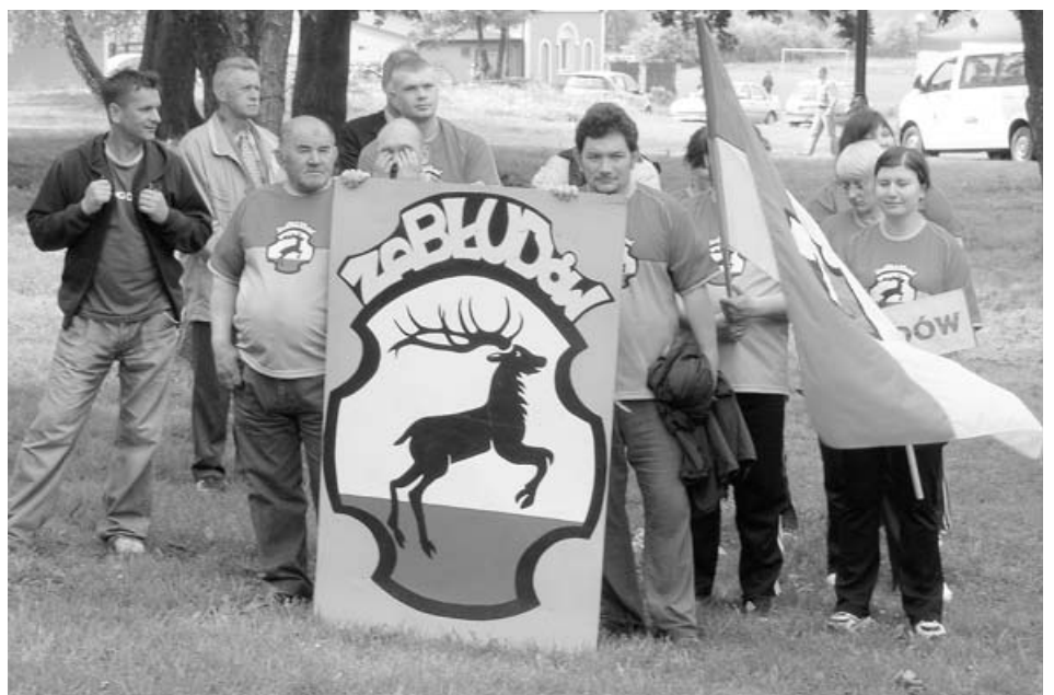
Z tą ekipą nikt nie wygra