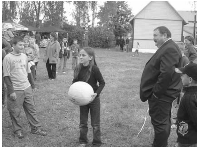
Ależ ta piłka jest ciężka

Jak co roku festyn rozpoczął się Mszą św. w wiejskiej kaplicy, przy której stoi drewniana figura św. Jana Nepomucena. Następnie oficjalnie rozpoczęto imprezę konkursami dla dzieci.