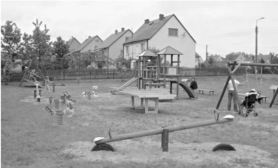
Nowy plac zabaw przy ul. Dembińskiej

W drugiej połowie maja oddano do użytkowania najmłodszym mieszkańcom Zabłudowa nowe place zabaw. Był to prezent władz miasta z okazji Dnia Dziecka.