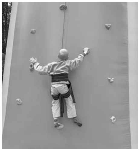
Wspinać się nie jest łatwo