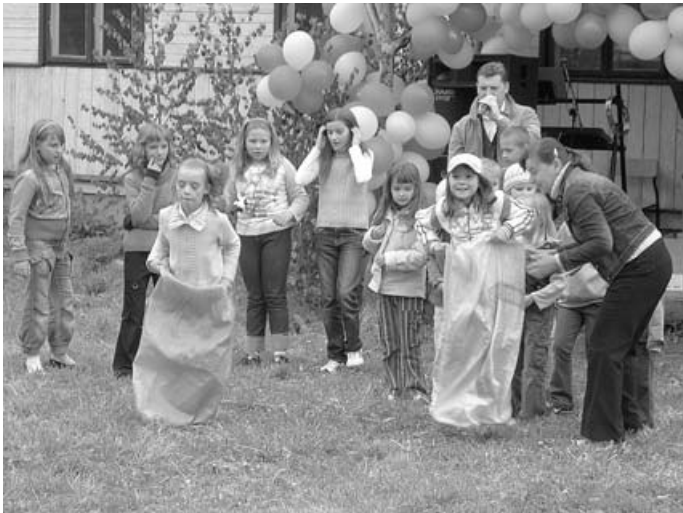
Wyścigi w workach to świetna zabawa

Przeciąganie liny dzieci i dorosłych, rzucanie piłką lekarską, podnoszenie ciężarków, wspólna zabawa – te i inne atrakcje odbyły się 17 maja w Kurianach, podczas szóstego festynu z okazji odpustu św. Jana Nepomucena. Zgromadził on liczne grono mieszkańców wsi.