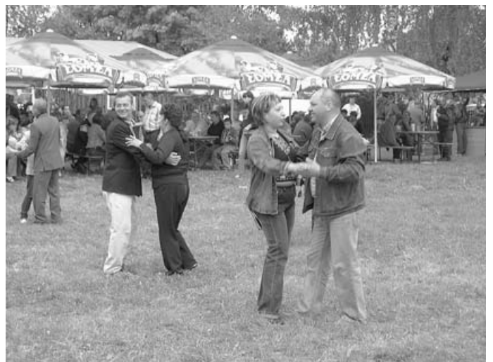
Przyszła kolej na tańce