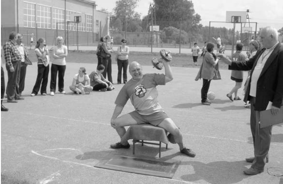
Jeszcze tylko dwa razy i rekord

Zabłudów po raz drugi z rzędu został zwycięzcą Spartakiady Sportowo-Rekreacyjnej Powiatu Białostockiego. Odbyła się ona w naszym mieście 22 maja br. Na drugim miejscu uplasowała się reprezentacja Gminy Gródek, na trzecim Dobrzyniewa.