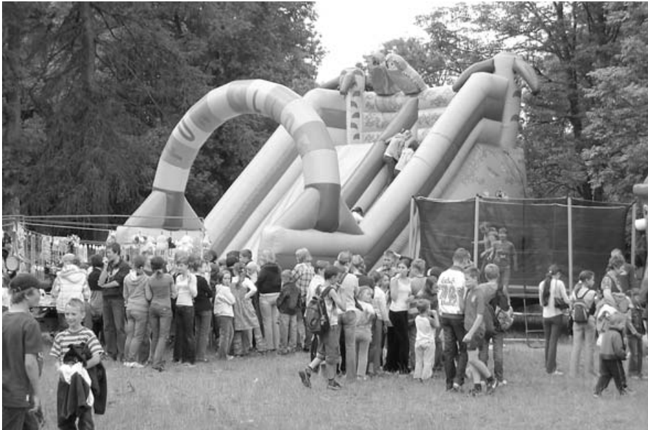
Festyn Rodzinny w Zabłudowie

Na kwietniowej sesji Rady Miejskiej Zabłudowa przedstawione zostało sprawozdanie z działalności Miejskiego Ośrodka Animacji Kultury (MOAK) za 2008 rok. Poniżej przedstawiamy jego skrót.