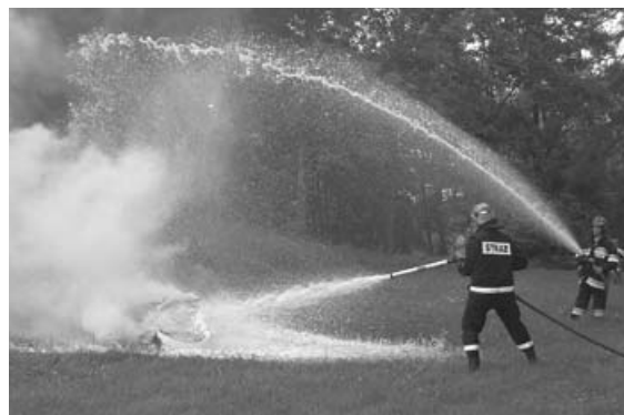
Strażacy pokazali co potrafią