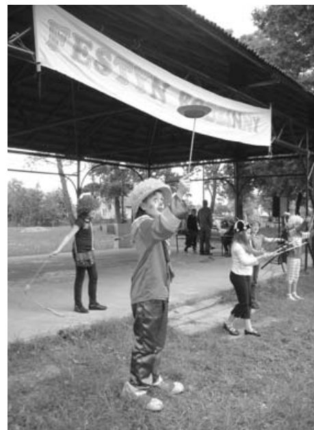
Prawie jak w cyrku

Około 400 dzieci i młodzieży wzięło udział w Festynie Rodzinnym, który odbył się 6 czerwca br. w parku zamkowym.