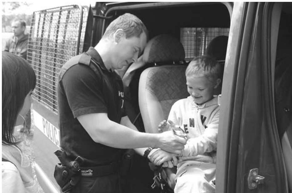
Mamy Ciebie gagatku