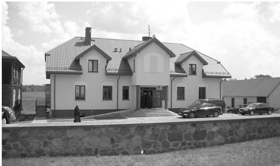
Nowa plebania przy kościele

Ponadto udzielił sakramentu bierzmowania młodzieży i spotkał się z Radą Parafialną, Domowym Kościołem, Kołami Żywego Różańca, ministran-