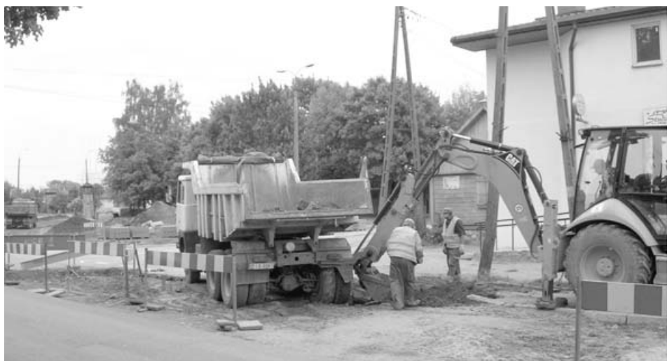
Robotnicy przy pracy

Remont ulicy Białostockiej, czyli roboty drogowe plus nadzór kosztować ma około 7,5 mln zł. PW