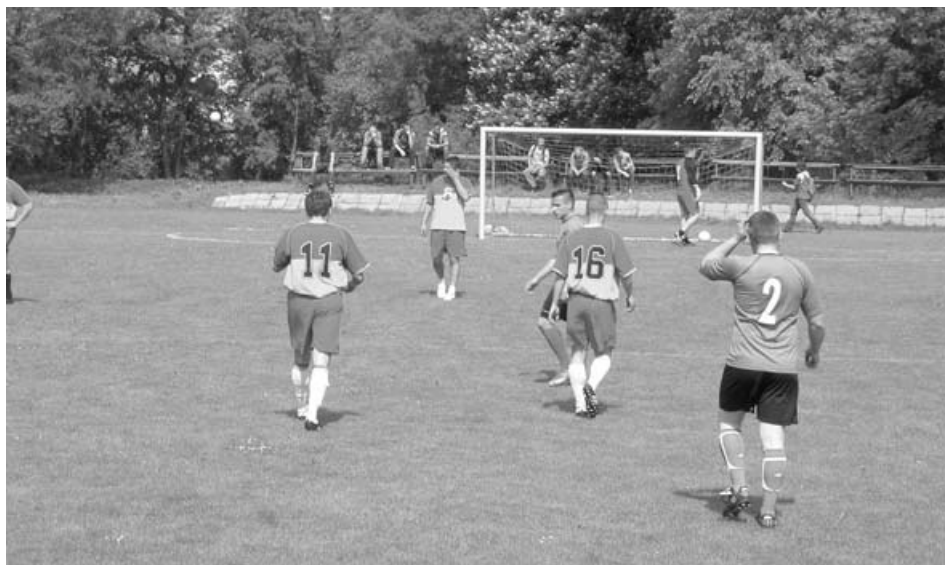
PW W piłkę to my potrafimy grać