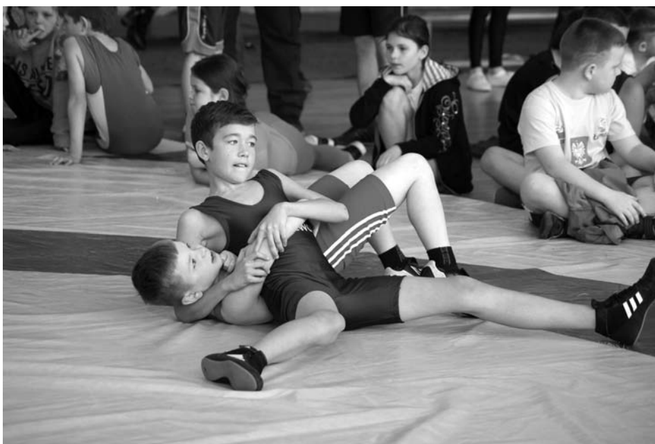
Walki były naprawdę zacięte

– Cieszę się, że tego rodzaju imprezy dotarły do Zabłudowa. Widzę, ogromne zainteresowanie dzieci i młodzieży oraz chęć konkurowania. Sport uczy uczciwej rywalizacji i tego życzę, nie tylko zawodnikom na dzisiejszym turnieju, ale nam wszystkim w różnych obszarach