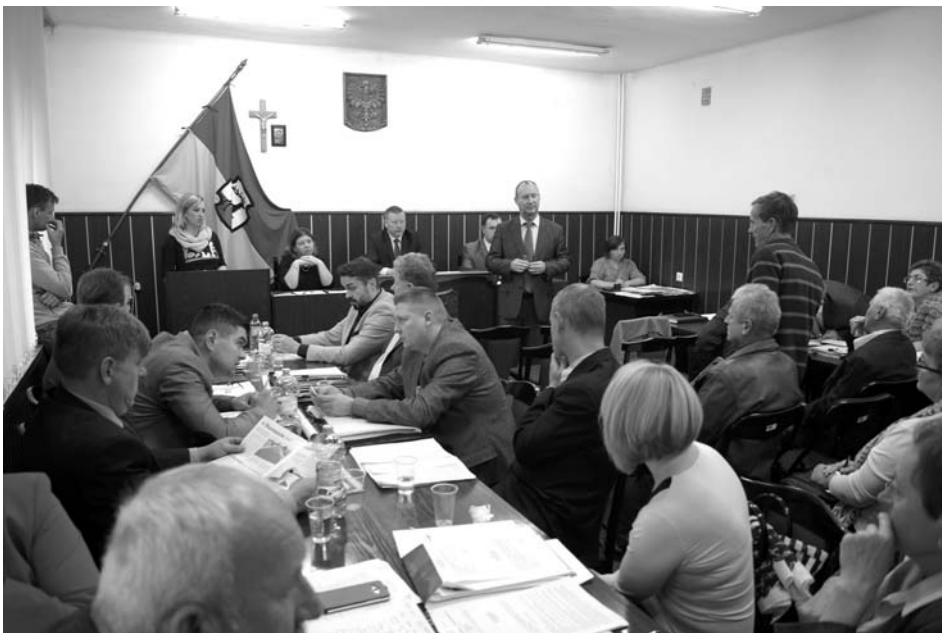
Jedna z jesiennych sesji zabłudowskiej Rady Miejskiej

Opłatę targową pobiera się bezpośrednio od sprzedającego w dniu sprzedaży. Sprzedający może uiścić ją w dniu sprzedaży na rachunek bankowy Urzędu Miejskiego w Zabłudowie.