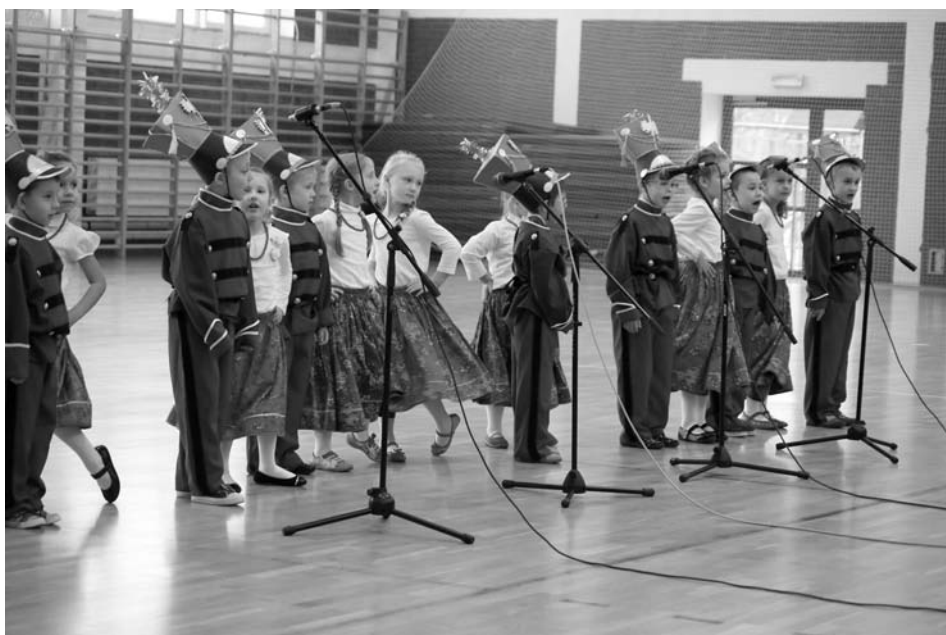
Największy aplauz na festiwalu wzbudziły barwnie przebrane pierwszaki