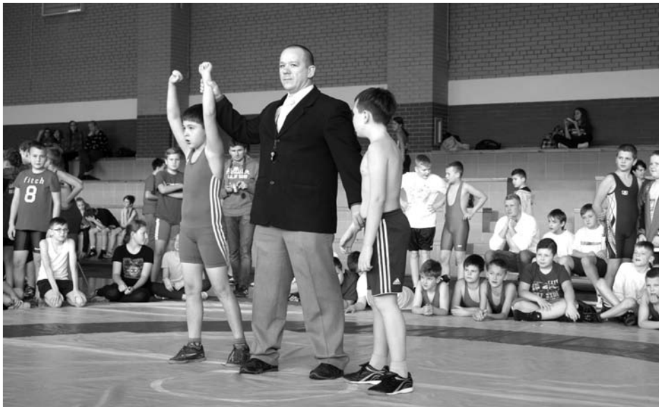
PW ■ Każda walka kończyła się zwycięstwem jednego z zawodników

Warto wspomnieć, że w zabłudowskim turniej uczestniczyli reprezentanci ośmiu klubów z województwa podlaskiego, od Suwałk po Juchnowiec, a w klasyfikacji drużynowej UAKS „Podlasie” Zabłudów - Białystok zdobył 58 punktów i zajął pierwsze miejsce.