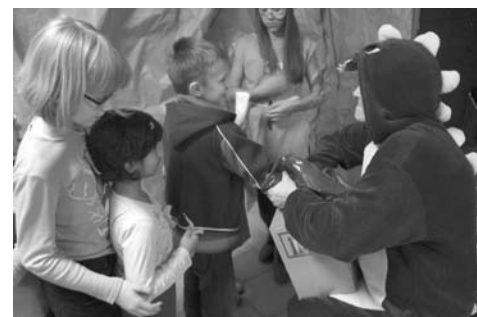
Zabawa Andrzejkowa w Miejskim Ośrodku Animacji Kultury w Zabłudowie