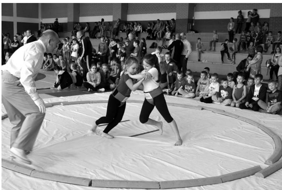
Dziewczynki bez problemów radziły sobie ma matce