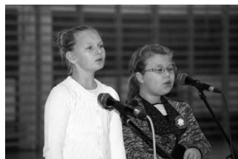
Szkołę Podstawową w Dobrzyńówce reprezentował duet

zauważyła, że dzieci bardzo chętnie i z wielką radością przygotowywały się do występu. – Dużym przeżyciem było dla nich przebranie się w piękne stroje. Dziewczynki były bardzo zadowolone z kolorowych spódnic i czerwonych koralików, zaś chłopcy byli dumni ze strojów ułańskich. Jestem z ich występu naprawdę bardzo zadowolona – zaznaczyła.