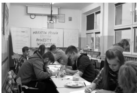
Maraton pisania listów w zabłudowskim gimnazjum

Tegoroczny maraton pisania listów w Zabłudowie trwał od godz. 8.00 do 18.00. Rozpoczął się on jak co roku