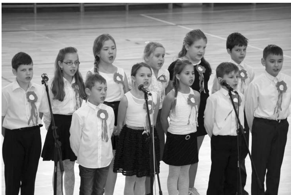
Klasa III B podczas festiwalu

Jedną z grup, a dokładnie uczniowie klasy IB ze Szkoły Podstawowej w Zabłudowie zapamiętają występ na dłużej. Pomimo, że wystąpili po raz pierwszy to otrzymali najgorętsze brawa. Ich wychowawczyni Sylwia Popławska